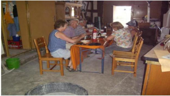
Die Deele vor der Renovierung

Neuerungen im Museum „Haus Reining“ Renovierung der Deele mit Erlösen aus Kartoffelfesten und Spenden in ehrenamtlicher Arbeit fertiggestellt